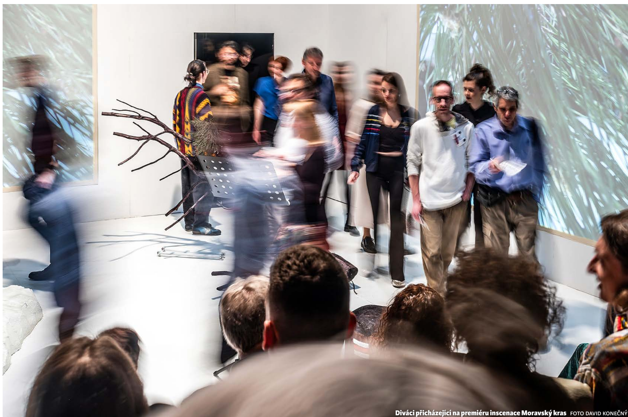
Diváci přicházející na premiéru inscenace Moravský kras