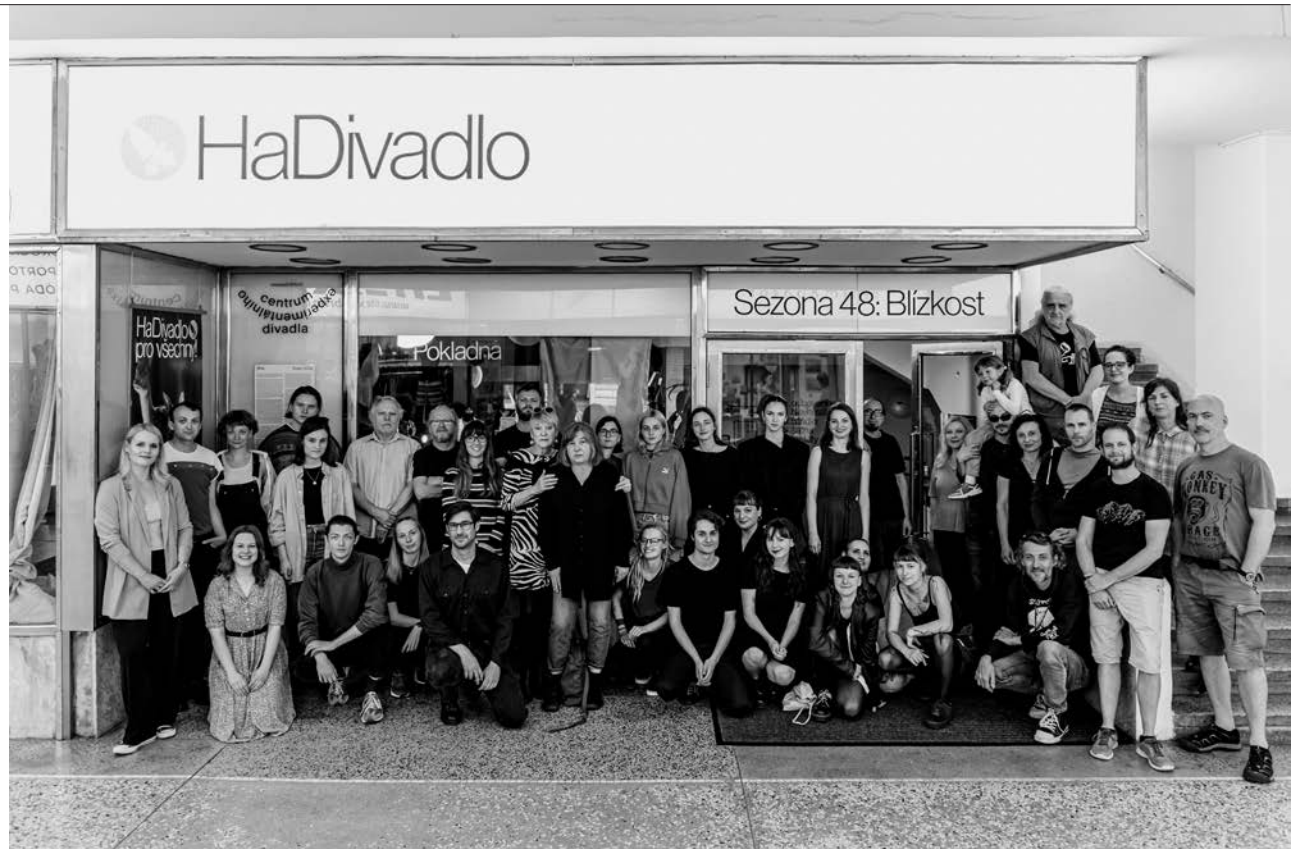
Kolektiv HaDivadla na konci Sezony 48: Blízkost

Na dramaturgické úrovni se HaDivadlo v rámci svého programu intenzivně snaží o aktivní dialog s diváctvem i zapojování různých skupin publika. To je patrné třeba na tom, jak se proměňuje jazyk manifestů k novým sezonám – postupně se zjednodušuje a zpřístupňuje. Z intelektuálního elitářství se snaží přecházet ke všeobecně srozumitel-