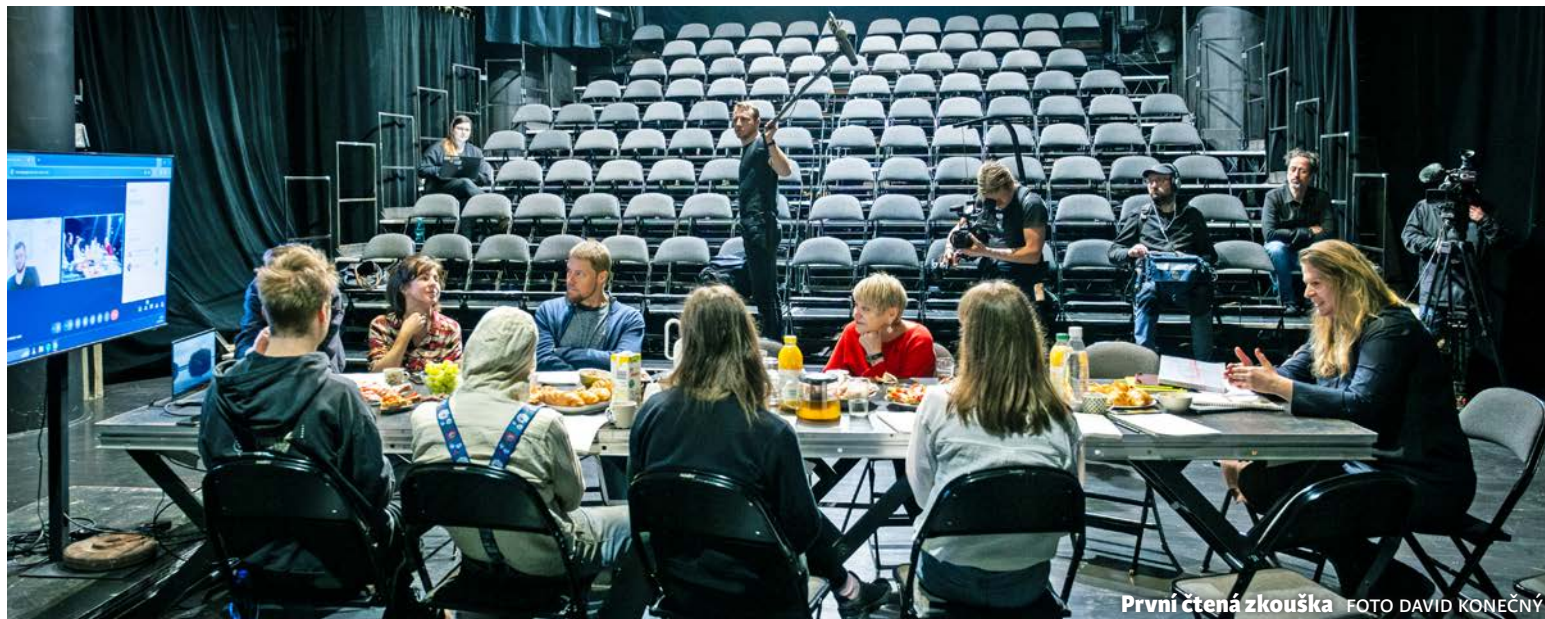
První čtená zkouška